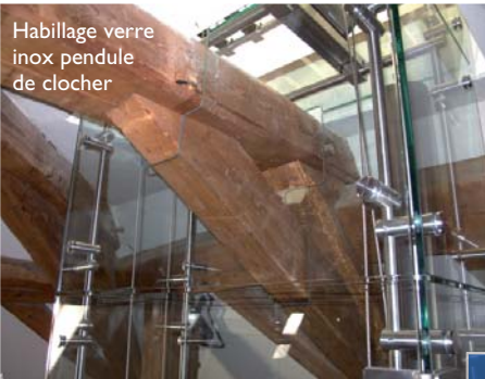
Habillage verre inox pendule de clocher