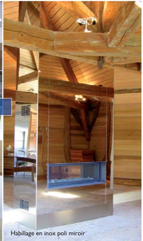
Habillage en inox poli miroir