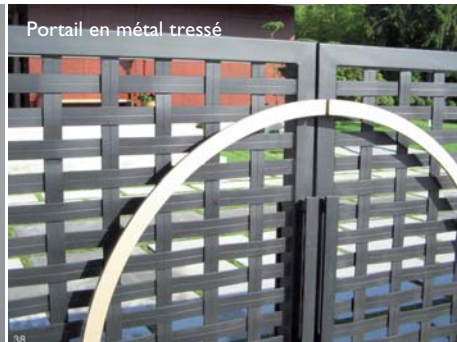
Portail en métal tressé