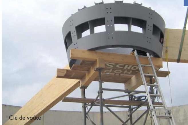
Clé de voûte